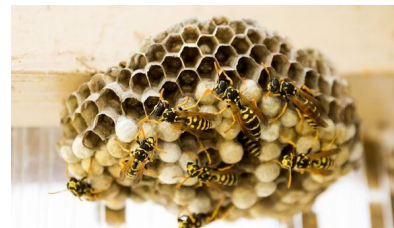
nido di vespe

In presenza di api bisogna attivare sempre gli Apicoltori locali per la cattura degli sciami.