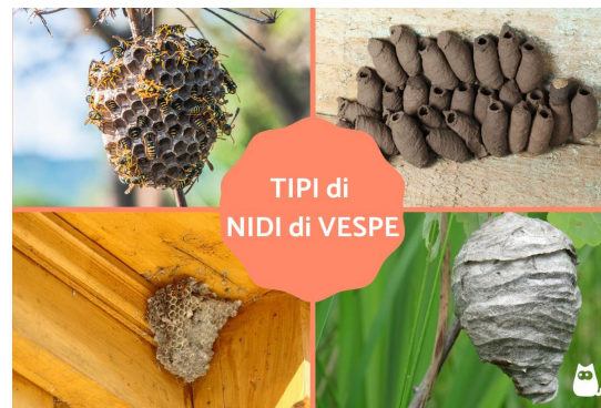
Realizzazione e grafica f. donato

Molti insetti assomigliano ad un ape o ad una vespa, ma non sono affatto velenosi, cercare quindi di mantenere la calma nel caso uno di questi insetti entrasse in casa o fosse presente in casa. Se un insetto riconoscibile come un ape, vespa e simile entra in un veicolo in moto, mantenere la calma, accostare il veicolo ai margini della strada dopo le opportune segnalazioni, cercare di far uscire l'insetto dai finestrini. Nel caso in cui l'insetto cercasse invano di uscire dal parabrezza anteriore o dal vetro posteriore, coprire dall'esterno gli stessi con un panno e contemporaneamente aprire i finestrini laterali. Gli insetti cercano di fuggire sempre in direzione della luce.